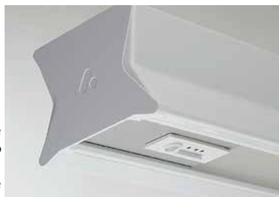
Tutti gli apparecchi di illuminazione sono dotati di sensori incorporati per il rilevamento preciso dei movimenti e condizioni di illuminazione ottimali.

L'illuminazione corretta rappresenta un elemento fondamentale per creare un ambiente di apprendimento stimolante. iQ Connect è una nuova soluzione intelligente basata su un sistema di comunicazione completamente wireless. Tutti gli apparecchi di illuminazione sono dotati di sensori incorporati per un completo monitoraggio dei movimenti e per creare condizioni di illuminazione ideali. Questa soluzione si auto regola e fornisce un livello di illuminazione uniforme in tutta la classe. Gli apparecchi di illuminazione sono pre-programmati in base all'aula specifica e possono essere installati direttamente. Si tratta di una soluzione ad elevata efficienza energetica che permette di risparmiare sia tempo che costi di installazione. La soluzione viene fornita con pulsanti wireless senza batteria.