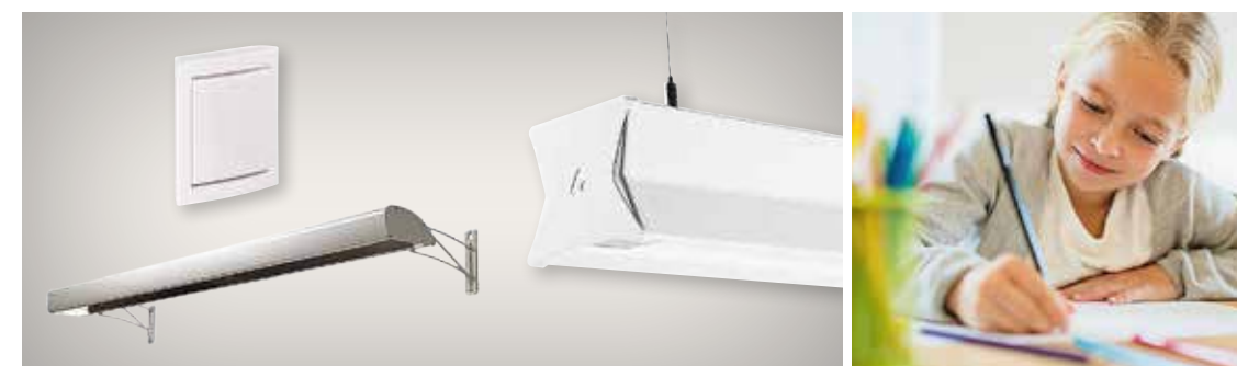
Lezzon è un apparecchio per illuminazione generale che offre elevata efficienza energetica e ridotti costi di manutenzione. Fornisce il 65% di luce diretta e il 35% di luce indiretta. Znap è un perfetto apparecchio di illuminazione per lavagne che permette di eseguire il lavoro in condizioni ideali e senza abbagliamenti. È adatto per inserire la fonte luminosa sostituibile Aura UltiLED Long Life. Il controllo manuale può essere realizzato attraverso un pulsante wireless, con funzionamento senza batteria

«iQ Connect – Smart School è una soluzione ad elevata efficienza energetica che permette di risparmiare sia tempo che costi di installazione per voi e i vostri clienti»