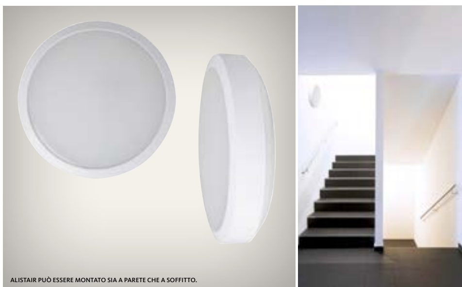
ALISTAIR PUÒ ESSERE MONTATO SIA A PARETE CHE A SOFFITTO.